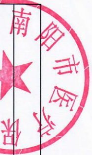
项目支出绩效自评情况表