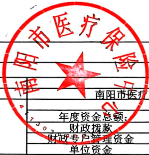
项目支出绩效自评情况表